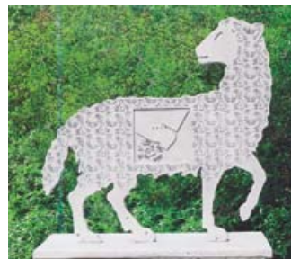
Lamm Aluguss 48x48x2 cm